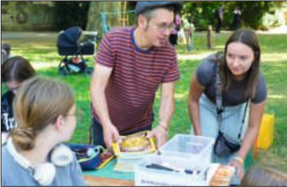
Kiezfest im Park der Jugend