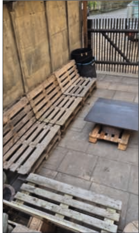
Sitzecke im Garten